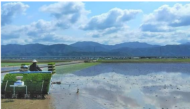
いちほまれ圃場風景

秋田ではこの秋本格デビューのサキホコレ田植えイベントが行われたそうです。 ご当地ヒーローの超神ネイガー!?!やらサキホコレダンサーズ!!!による舞の披露などで盛り上がったようです。 田植えは今週がピークとなります。 ダンサーズもさぞ忙しいでしょうね